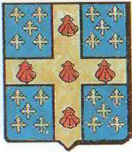
La Maison d'ARGENTEAU

« d'azur à la croix d'or chargée de cinq coquilles de gueules posées en croix et cantonnée de vingt croisettes recroisetées d'or »