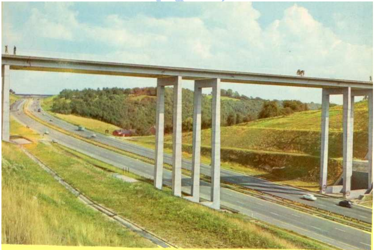
Autoroute "Roi Baudouin" (Anvers-Aix-La-Chapelle). Pont sur l'autoroute, à Cheratte.