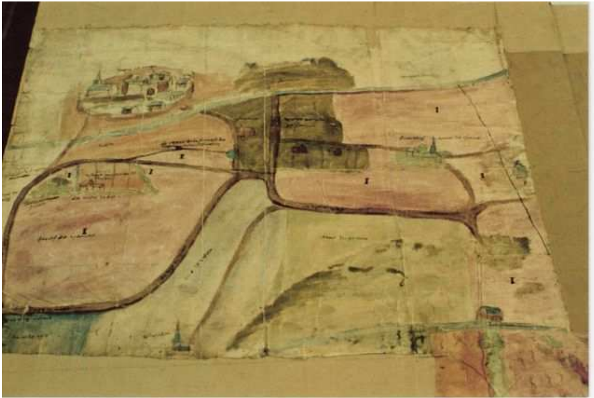
Partie nord de la carte avec au-dessus à gauche le château de Dalhem. Les terres contestées sont colorées en foncé en bas et à droite du château.

A deux reprises, il y eut procès entre le ban de Cheratte et la ville de Dalhem, à partir de terres que ceux de Dalhem prétendaient appartenir à leur franchise, et que ceux de Cheratte considéraient comme usurpées par ceux de Dalhem.