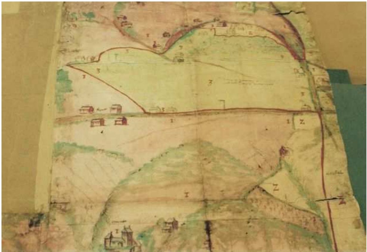
Partie sud supérieure de la carte montrant la voie principale qui traversait les hauteurs de Cheratte et la partie « barchonnaise » tout au-dessus