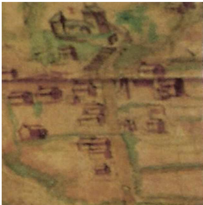
Détail du centre de Cheratte avec l'ancienne église et la rue du Curé