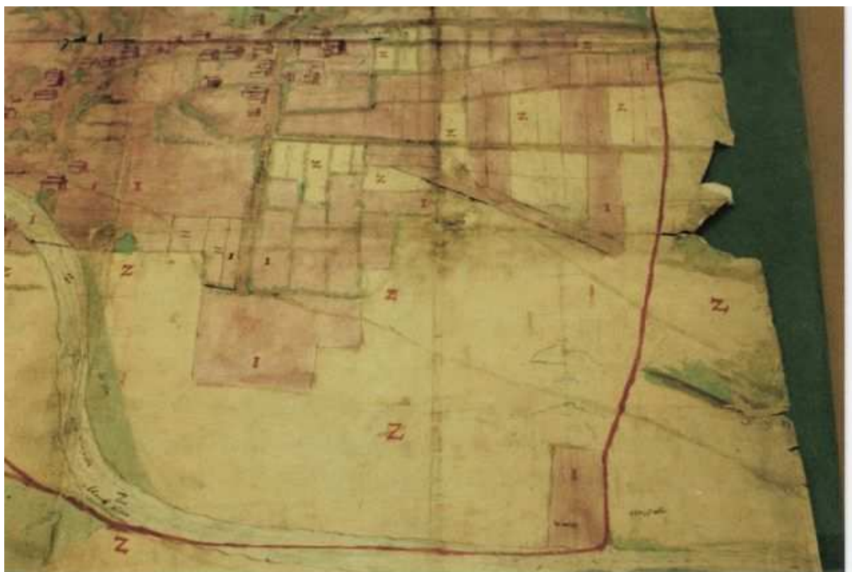
Partie sud inférieure de la carte montrant la campagne à la limite de Wandre et quelques parcelles de terres enclavées. A remarquer les limites au niveau de la Meuse.